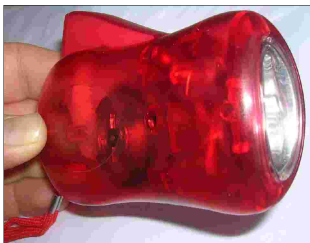
Lampes dynamo rouges